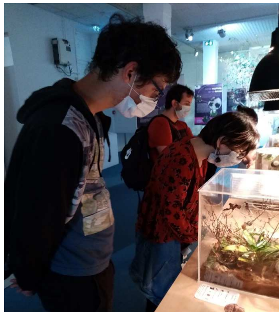
Collectif d'habitants qui partagent des sorties, des loisirs