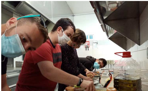
Réunion d'échanges sur le dispositif avec PARTENAIRES/ JEUNES/ FAMILLES