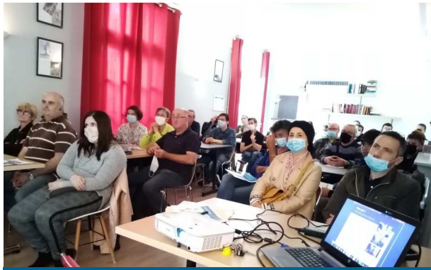
Réunion d'échanges sur le dispositif avec PARTENAIRES/ JEUNES/ FAMILLES