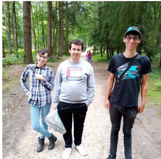
Collectif d'habitants qui partagent des sorties, des loisirs