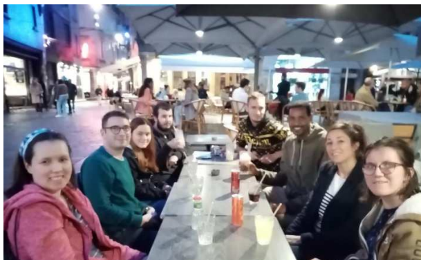
Sortie dans le vieux Tours et repas partagé